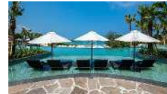
泊：ハイアットリージェンシー瀬良垣アイランド沖縄