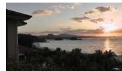
泊：ザ・ブセナテラス