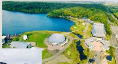
(公財)アイヌ民族文化財団