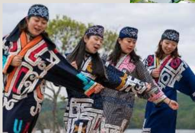
(公財)アイヌ民族文化財団