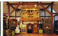
オルゴール博物館