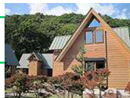
フォスターヴィレッジ